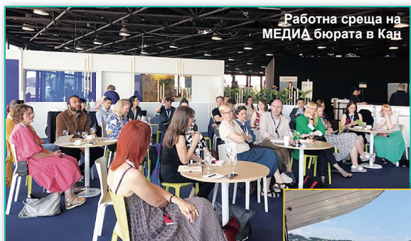
Работна среща на МЕДИА бюрата в Кан

76-ото издание на филмовия фестивал в Кан се проведе от 16 до 26 май 2023. Девет филма, подкрепени от „Творческа Европа“ – МЕДИА, участваха в официалната програма на фестивала, като 4 от тях бяха в конкурсната програма в надпревара за Златната палма.