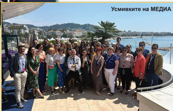
Усмивките на МЕДИА

Докато възстановяването от пандемията продължава, секторът е изправен пред нарастваща конкуренция