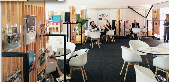
Щандът на Творческа Европа МЕДИА в Кан

На традиционния щанд на МЕДИА имаше няколко събития, фокусиращи върху трите клъстера на подпрограмата – бизнес, публика и съдържание. Целта им бе да предоставят възможност за срещи и дискусии на бенефициери, както и обмен на знания и опит. Също по традиция, всички колеги от бюрата на програмата в различните страни, бяха на разположение за консултации и информация по въпроси свързани с процедурите по кандидатстване.